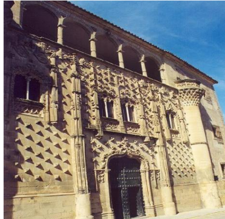
Palacio de Jabalquinto (Baeza)