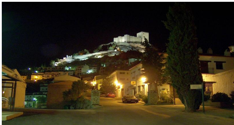
Vista de Segura de la Sierra.

Segura de la Sierra es el pueblo más cercano a Las Herrerías –a escasos 20 minutos. Este pueblo fue escogido como fortaleza de Moros y Crisitanos y alardea de una Fuente Imperial y baños árabes, así como maravillosas vistas.