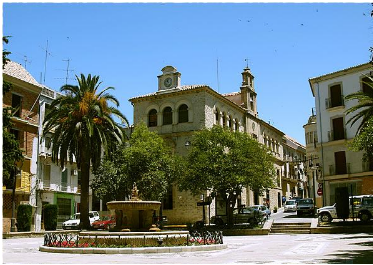
Villacarrillo, plaza del Ayuntamiento.

Segura de la Sierra es el pueblo más cercano a Las Herrerías –a escasos 20 minutos. Este pueblo fue escogido como fortaleza de Moros y Crisitanos y alardea de una Fuente Imperial y baños árabes, así como maravillosas vistas.