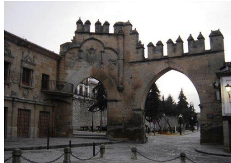
Plaza de los Leones (Baeza)

En la provincia de Jaén pueden encontrarse otras ciudades que albergan otros monumentos de interés artístico, histórico y cultural. Además cuentan con hoteles y restaurantes que pueden localizar fácilmente con nuestra ayuda.