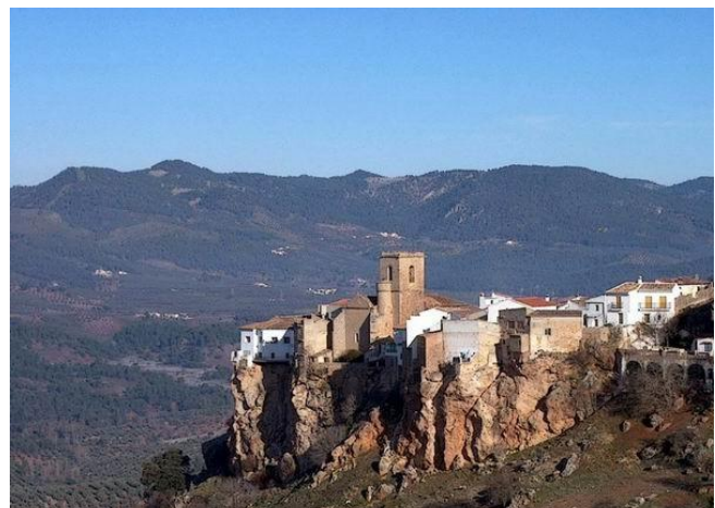
Vista de Hornos de Segura.