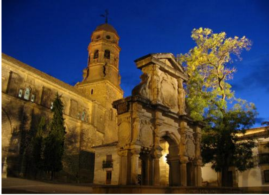
Catedral (Baeza) .

Baeza – ciudad de origen romano. Entre los monumentos a destacar de esta ciudad encontramos la Catedral, construida sobre una antigua mezquita que a su vez había sido construida sobre un templo pagano. Otros monumentos son; El Palacio de Jabalquinto, el Seminario de San Felipe Neri, y La Fuente de los Leones.