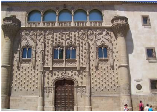
Palacio de Jabalquinto (Baeza)